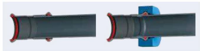
Fig. 1 – dwarse doorsnede voor en na het persen

Door de materiaaleigenschappen van de buis en de persfitting vervormen deze gelijktijdig en gelijkmatig op twee plaatsen onder inwerking van de persbekken of -kettingen van de perstang. Een eerste vervorming achter de perskraag leidt tot een trekvast verbinding van persfitting en buis. Een tweede vervorming, vanuit drie richtingen, ter hoogte van de perskraag en dus de dichtring, leidt tot een dichte verbinding van persfitting en buis. De dwarse doorsnede (figuur 2) toont de fitting vóór en na het persen.